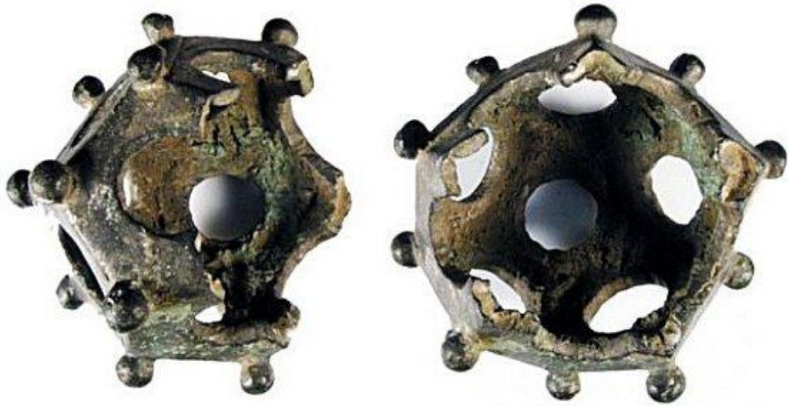
Strange 12-sided geometric artifacts known as "Roman dodecahedrons" have long baffled archaeologists.

Plusieurs personnes ont bien tenté de découvrir la vérité sur ce mystérieux artefact antique. Certains ont suggéré que le dodécaèdre était un instrument de mesure.