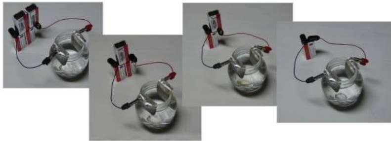
Diminution progressive du nombre de piles utilisées

jouera un rôle dans le processus. Tout ceci sans compter d'autres paramètres évidents tels que la distance entre les électrodes, la qualité de l'eau de départ, la surface d'argent accessible, etc. Pour ces raisons, il n'y a pas de "recette miracle" qui garanti une concentration particulière avec des paramètres donnés et fixes. Ne vous fiez pas trop à ce qu'on en dit sur le Net car plusieurs personnes donneront des indications précises en avançant que vous obtiendrez une concentration de X ppm. Ne prenez ces indications que comme un guide de départ car sans testeur de densité, l'opération se fait à l'aveuglette et chacun d'entre vous aura des résultats différents, et ce, sans même les connaître !